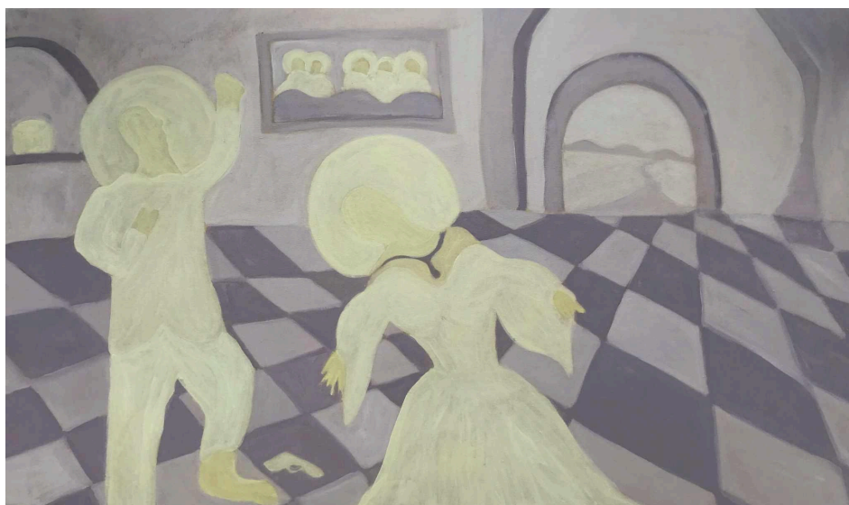
Noon Dreams, 2023, acrylic on canvas, ©Huỳnh Công Nhó

“Little by little, I realized that I was able both to draw my own ideas and to use them as documents of the filmmaking process – documents which were more interesting and more lively than photographic stills would have been.”