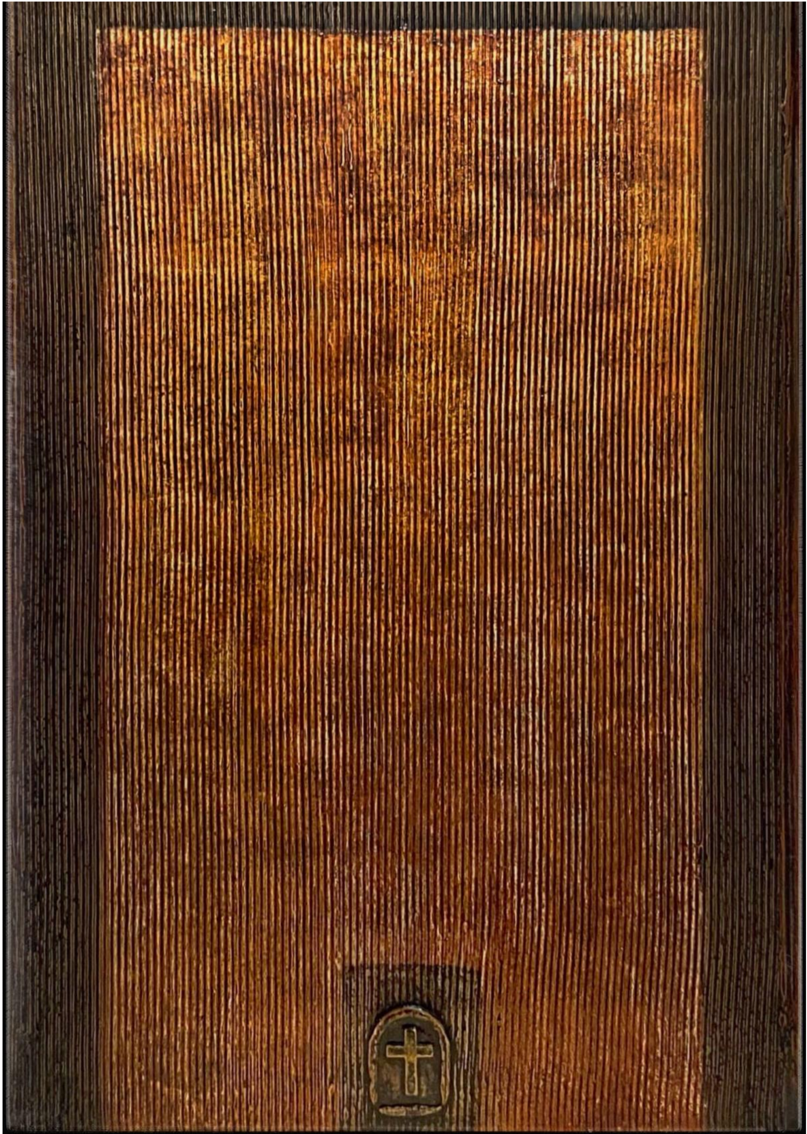
Tôn-Thất Minh-Nhật, The Apartment and The Church / Chung cư và Nhà thờ # 01 , 2023, sơn ta (sơn mài truyền thống Việt Nam).