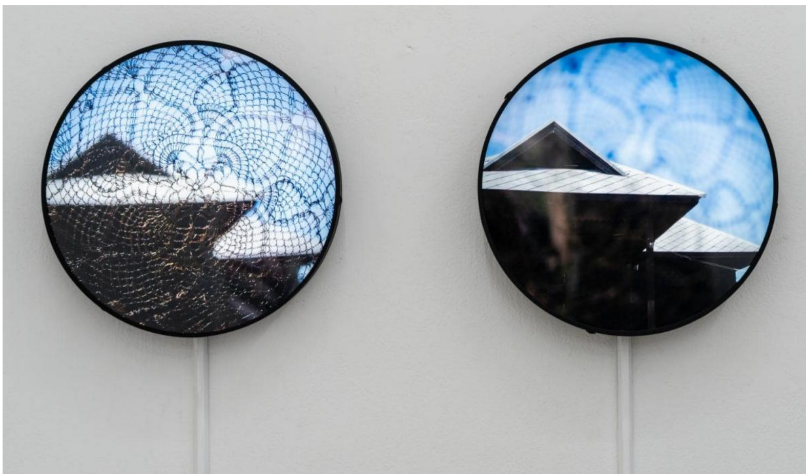
Imhathai Suwatthanasilp, See Through-See True: Hayeesulong's House , 2019.