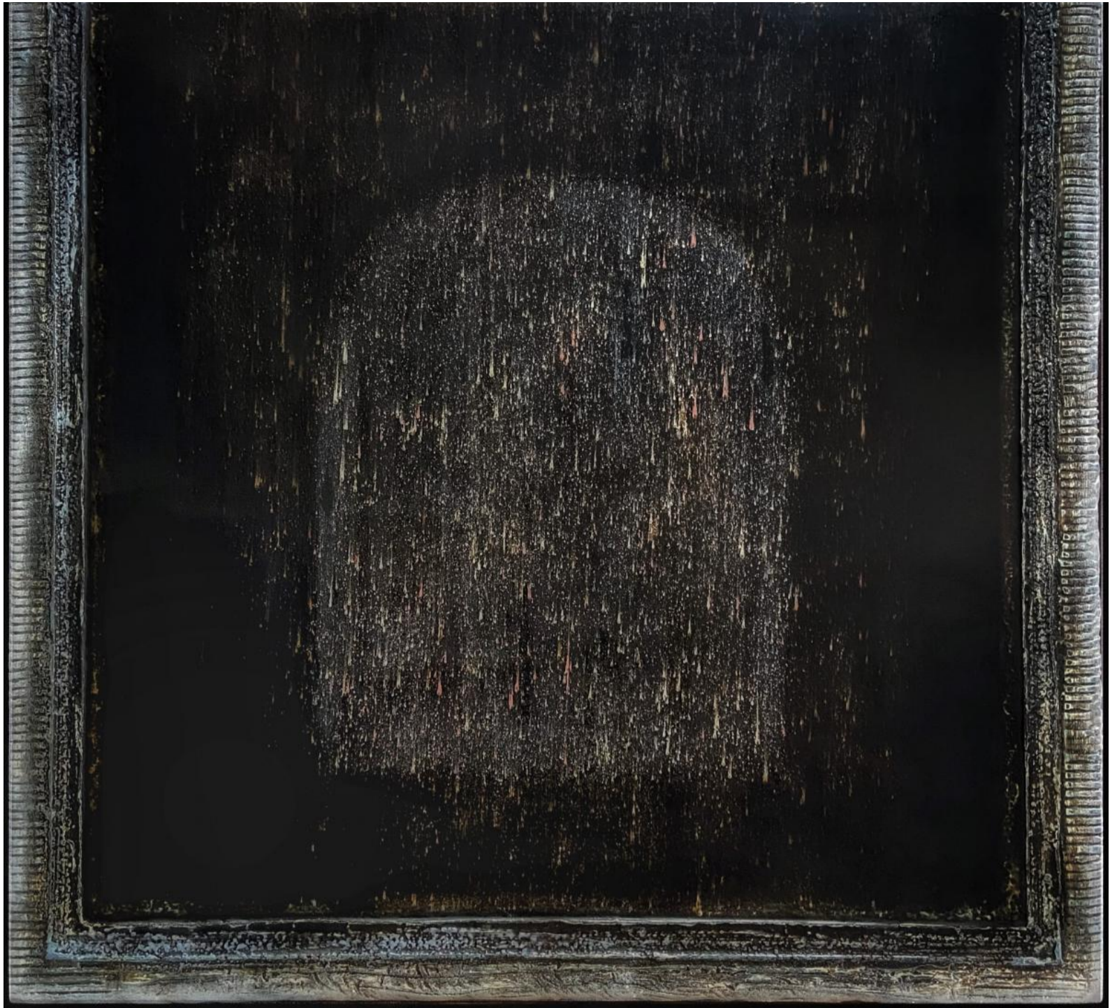
Tôn-Thất Minh-Nhật, Night rain / Mưa đêm , 2023, sơn ta (sơn mài truyền thống Việt Nam).