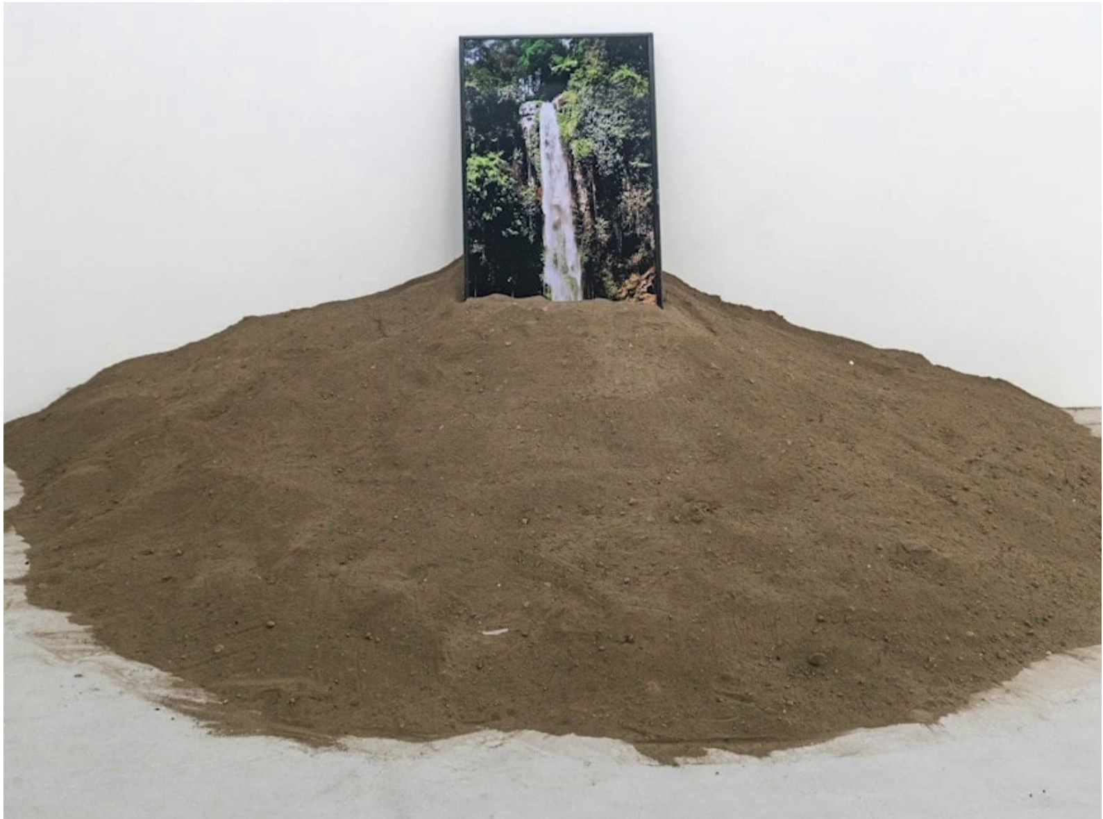
M. Irfan, Terpisah dari hujan (Detached from the rain) (tạm dịch: Tách khỏi cơn mưa), 2019, đất, video HD, màu.