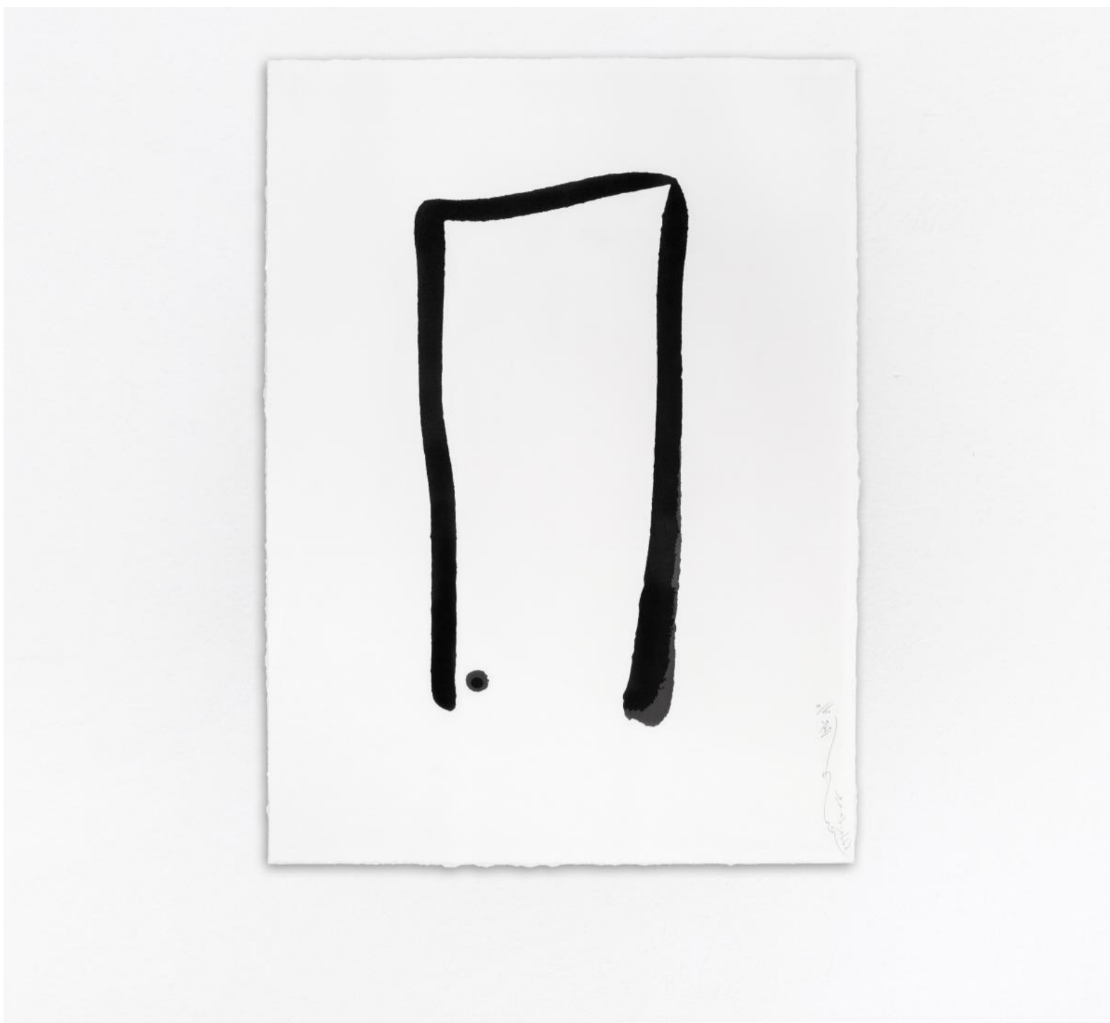
Kamin Lertchaiprasert, The door without door (tạm dịch: Cửa không có cửa), 2018, in lụa trên giấy.

Sử dụng chính cliché về vùng khí hậu nhiệt đới thường bị các nhà du hành phương Tây lạm dụng trong nhiều văn bản viết về ‘vùng viễn Đông’, triển lãm vén bức màn exotic để người xem có thể nhận thức được thực tại đang tiếp diễn.