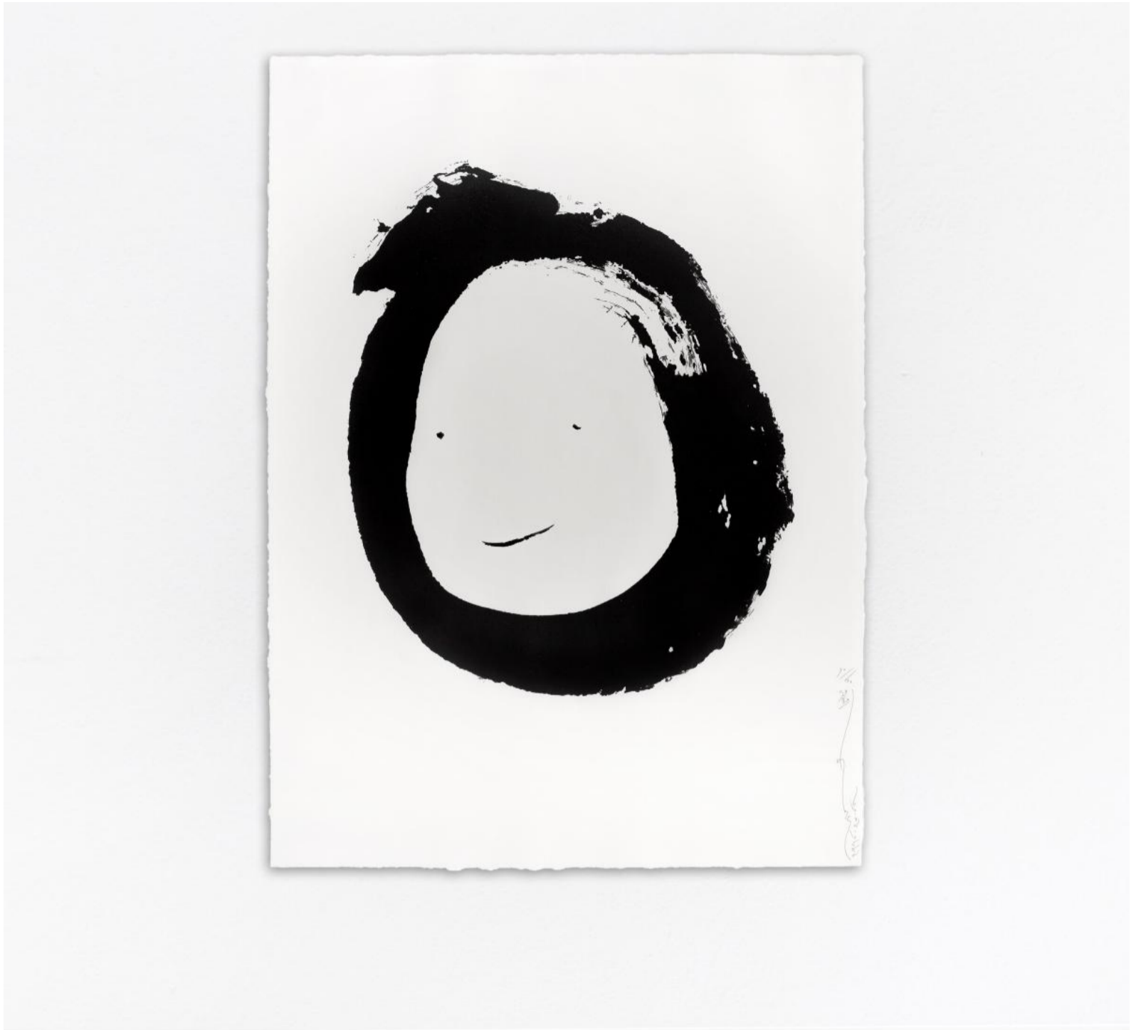
Kamin Lertchaiprasert, Nature Void , 2016, in lụa trên giấy.