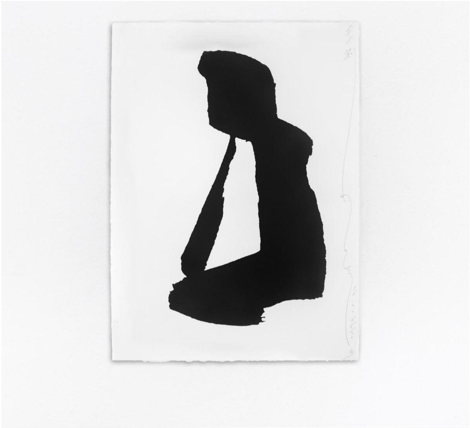
Kamin Lertchaiprasert, Sitting Still (tạm dịch: Ngồi yên), 2020, in lụa trên giấy.